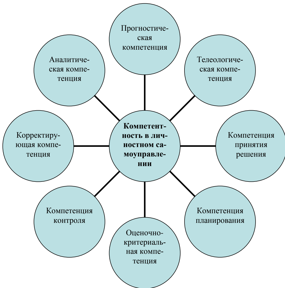
Рис. 3. Опоры компетентности в личном самоуправлении

Для удобства педагогического анализа нами введен следующий термин «компетентность в личностном самоуправлении», который, по сути, означает высокий уровень развития личностного самоуправления. Компетентность в личностном самоуправлении опирается на компетенции, лежащие в основе любой деятельности (рис. 3). Они являются как бы «сквозными», организующими общую компетентность человека, в том числе профессиональную.