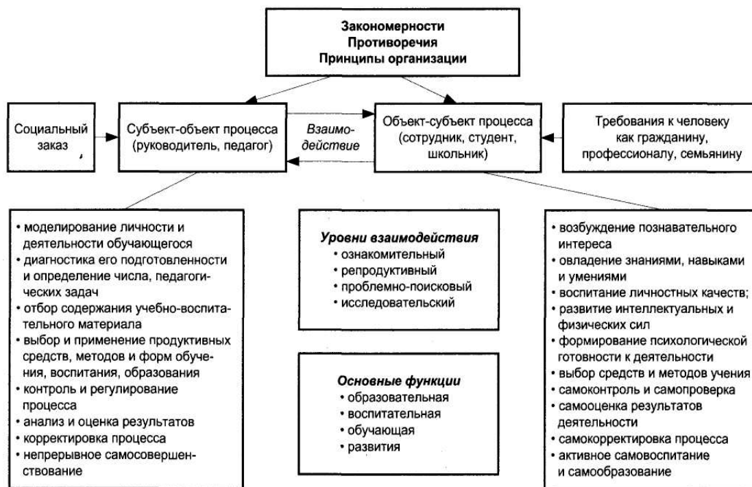
Рис. 1. Модель педагогического процесса 116

4. Целеустремленность – цели заданы потребностями общества и подчинены конкретному социальному заказу, который официально выражен в установленных законодательно нормах – общекультурных и профессиональных компетенциях.